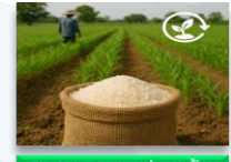
Broken rice - ปลาบั่วข้าว