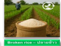
Broken rice - ปลายข้าว