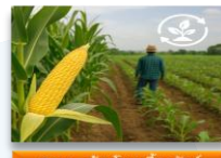
Corn - ข้าวโพดเลี้ยงสัตว์