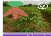
Casava - มันสำปะหลัง