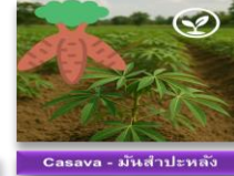
Casava - มันสำปะหลัง