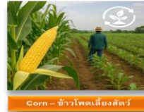
Corn - ข้าวโพดเลี้ยงสัตว์